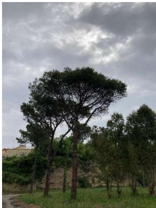
Pianta G: sopralluogo 06/05/2022 – T

Per quanto riguarda i livelli di infestazione di cocciniglia tartaruga rilevati con l'esame dei campioni raccolti durante i due sopralluoghi, si rimanda nel dettaglio alla relazione allegata di seguito. In sintesi, è possibile affermare che, a 31 mesi di distanza dall'applicazione endoterapica, il livello di colonizzazione dei pini trattati risulta nuovamente paragonabile al non trattato, segno dell'esaurimento degli effetti del trattamento.