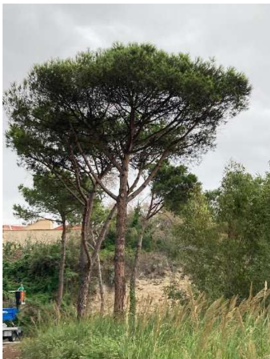
Pianta G: sopralluogo 21/10/2021 - T