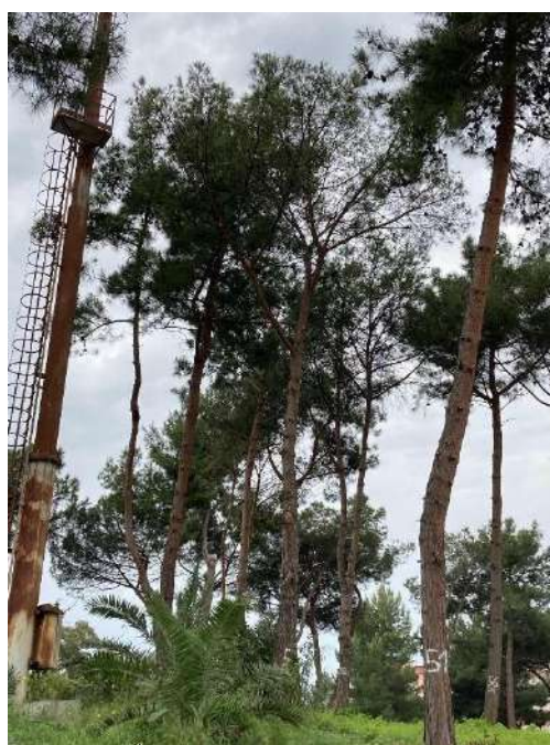
Pianta B: sopralluogo 06/05/2022 - NT