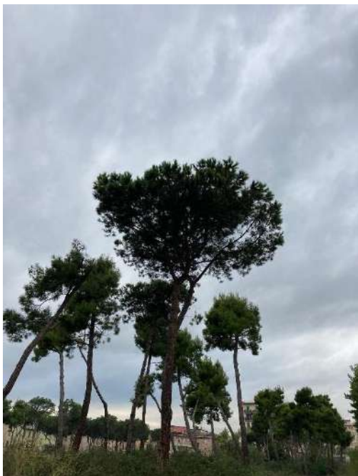
Pianta E: sopralluogo 21/10/2021 - T

La pianta contrassegnata con la lettera D , nonostante la sua presenza nell'area non trattata, risulta essere meno colpita rispetto alle altre 3 piante non trattate considerate come campioni. Questo molto probabilmente è dovuto alla vicinanza della pianta con l'area trattata, che ha fatto sì che la minor pressione del parassita nell'area trattata coincida con la minore infestazione di questa pianta.