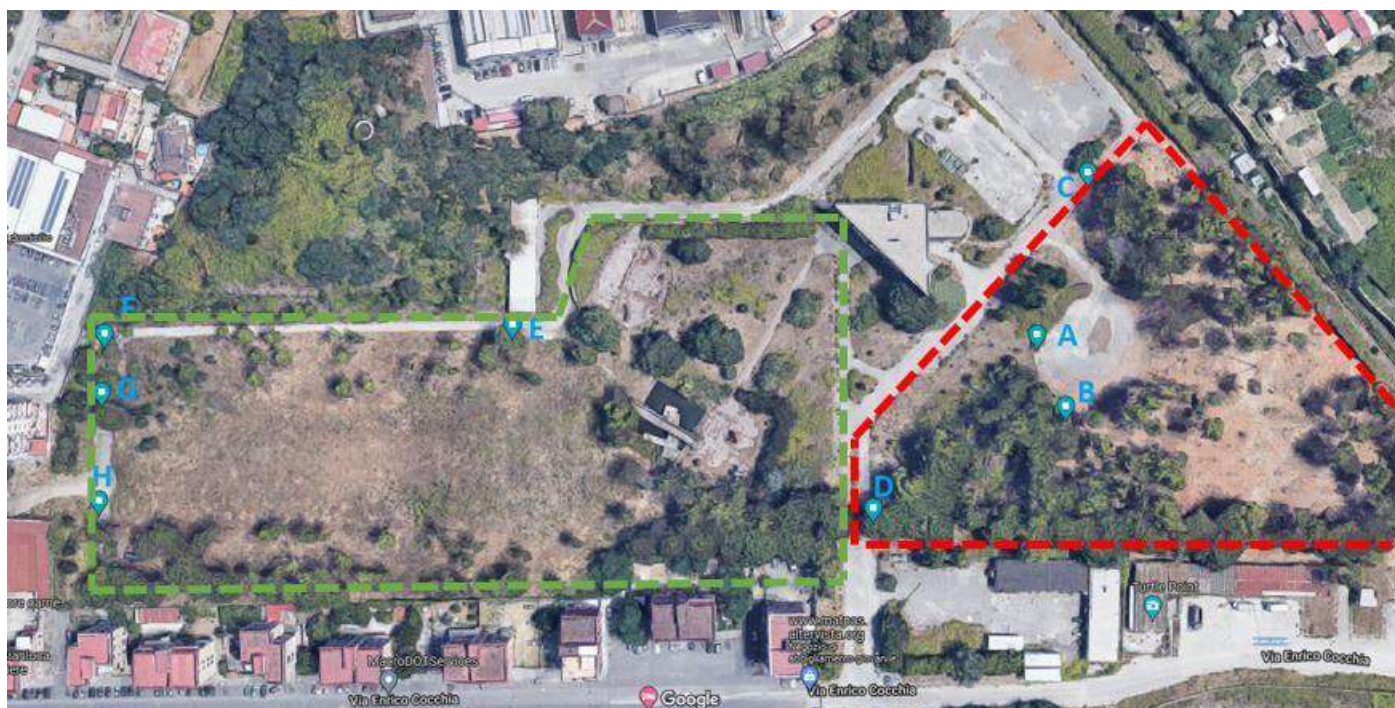
Tabella 1. Identificazione delle piante trattate e non trattate all'interno dei due plots.

Durante i sopralluoghi, nelle aree identificate inizialmente, sono state prese in considerazione 4 piante per ciascuna area, campionate a random all'interno delle suddette superfici, a seconda della facilità nel raggiungere la pianta con la piattaforma elevatrice. Le piante sono state contrassegnate con le lettere maiuscole dell'alfabeto: le prime 4 ad indicare le piante che non hanno subito il trattamento (indicate in rosso), le seconde 4 ad indicare le piante trattate (contrassegnate con il verde).