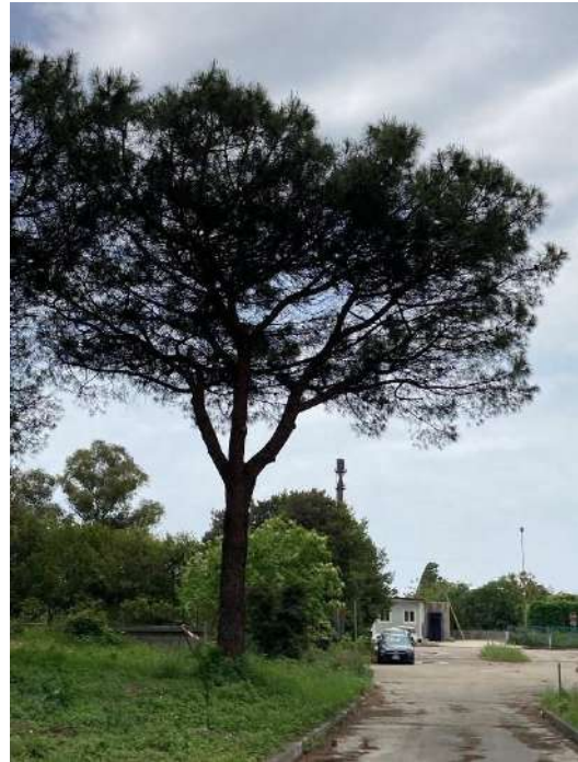
Pianta D: sopralluogo 06/05/2022 - NT

La pianta contrassegnata con la lettera D , nonostante la sua presenza nell'area non trattata, risulta essere meno colpita rispetto alle altre 3 piante non trattate considerate come campioni. Questo molto probabilmente è dovuto alla vicinanza della pianta con l'area trattata, che ha fatto sì che la minor pressione del parassita nell'area trattata coincida con la minore infestazione di questa pianta.