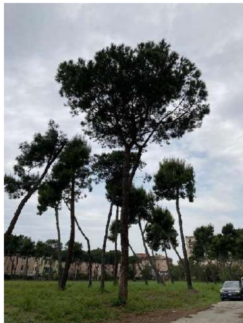
Pianta E: sopralluogo 06/05/2022 - T