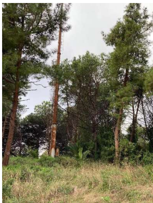
Pianta B: sopralluogo 21/10/2021 – NT

La vegetazione non trattata, quindi, risulta essere più debole e potenzialmente soggetta all'attacco di altri parassiti, quali funghi e altri insetti xilofagi, come ad esempio gli scolitidi.