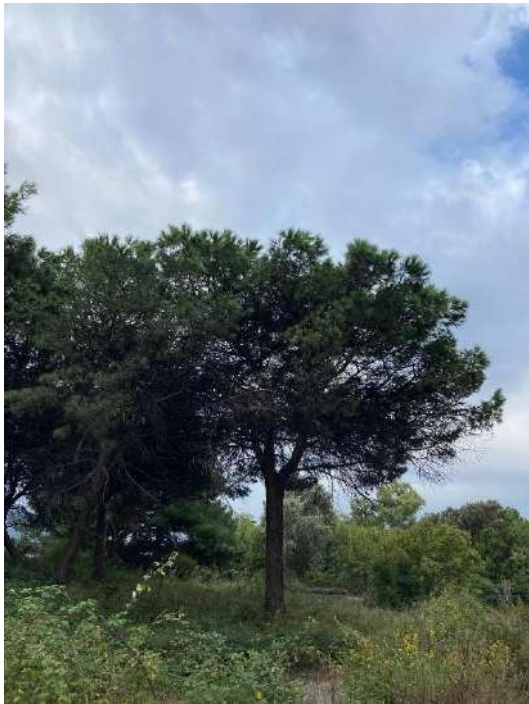
Pianta D: sopralluogo 21/10/2021 - NT